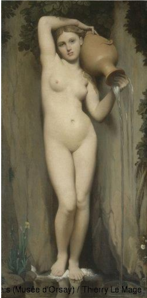
Jean Auguste Dominique INGRES (1780-1867) La Source , 1820-1856. Huile sur toile, 163x80 cm. Paris, musée d'Orsay

Deux références autour de La naissance de Vénus d'Amaury-Duval : La Source d'Ingres qui l'a inspiré sur la forme, et La naissance de Vénus de Botticelli, qui porte sur le même sujet.