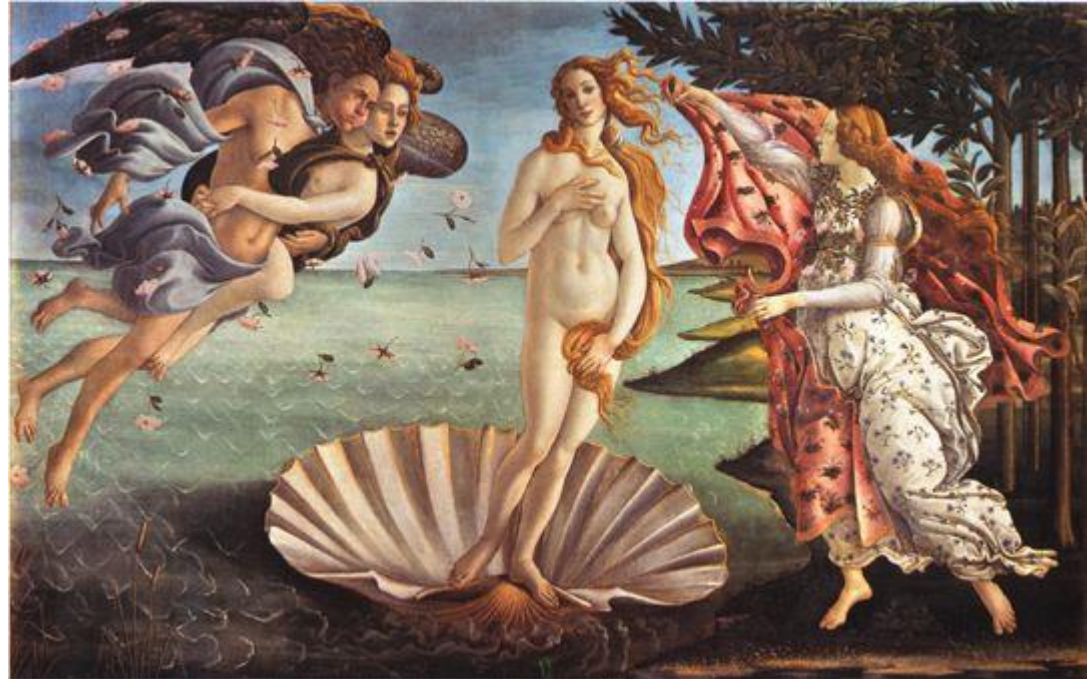
Sandro BOTTICELLI (1444-1510) La naissance de Vénus , 1484-1485, Tempera maigre sur Toile, 172.5 x 278.5 cm. Florence, Galerie des Offices